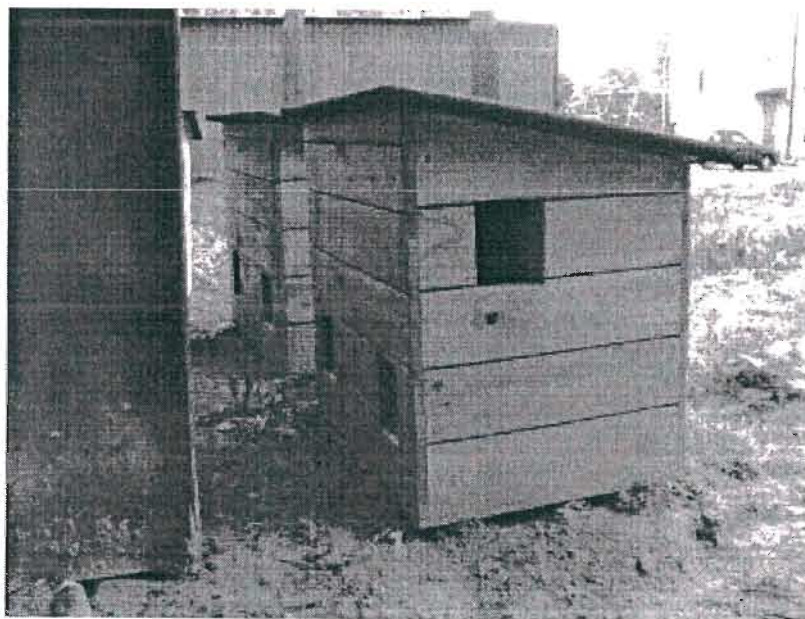
Przykładowe zdjęcie budki dla kotów