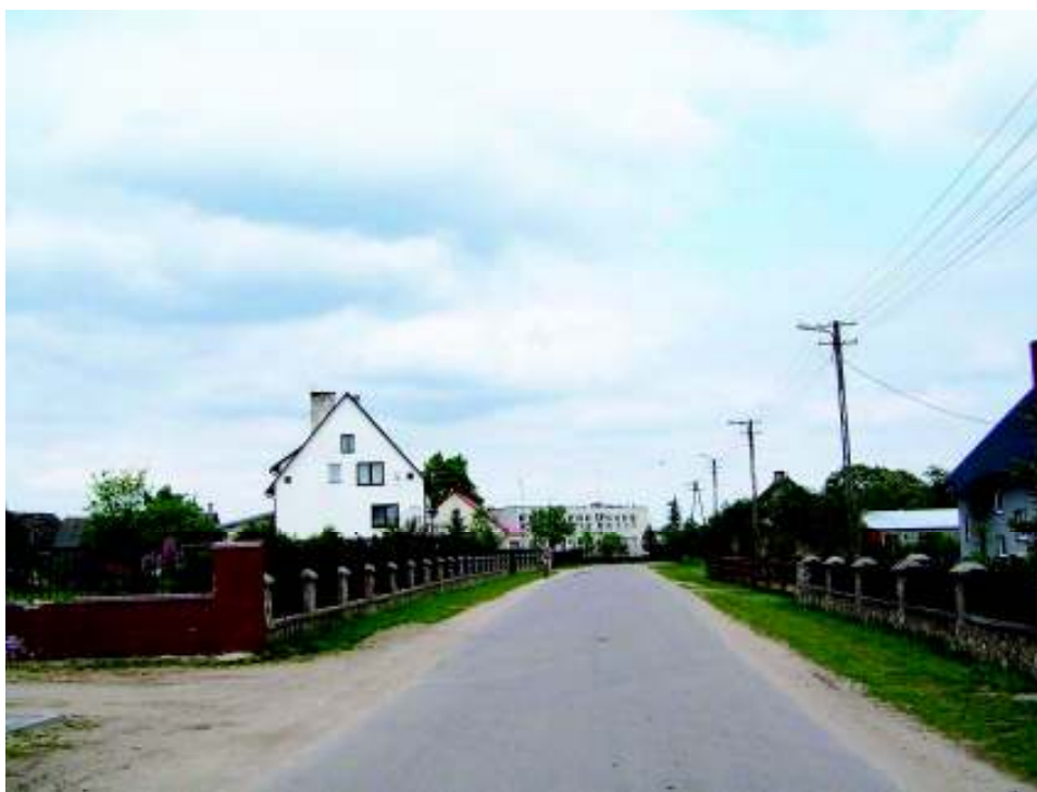
Rysunek 1. Krajobraz miejscowości

We wsi dominuje zabudowa mieszkalna parterowa i piętrowa, głównie murowana, coraz mniejsza jest ilość domów drewnianych, brak obiektów charakterystycznych dla regionu.