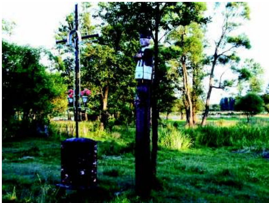
Rysunek 4. Kapliczka przydrożna w Krukowie