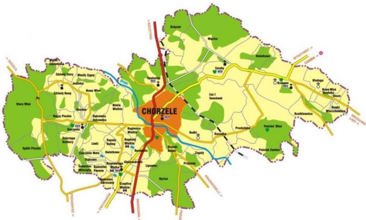
Rysunek 2. Mapa gminy Chorzele.

Powierzchnia gminy to około 371,53 km 2 , co czyni gminę największą na terenie województwa mazowieckiego. Administracyjnie gmina podzielona jest na miasto Chorzele i 41 sołectw, obejmujących 65 miejscowości.